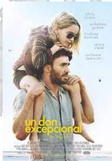
Un don excepcional