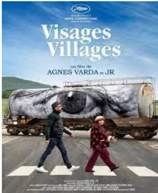
Caras y lugares