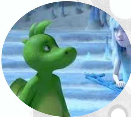
Tabaluga i la princesa de gel