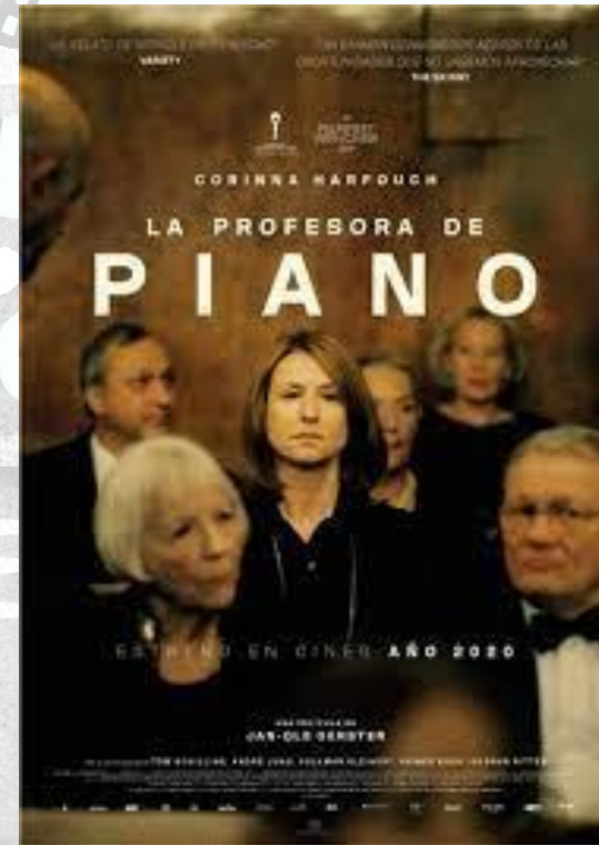
La profesora de piano