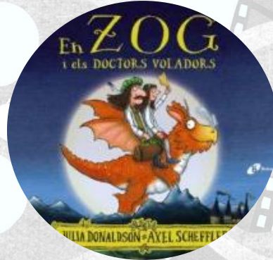
Zog i els doctors voladors