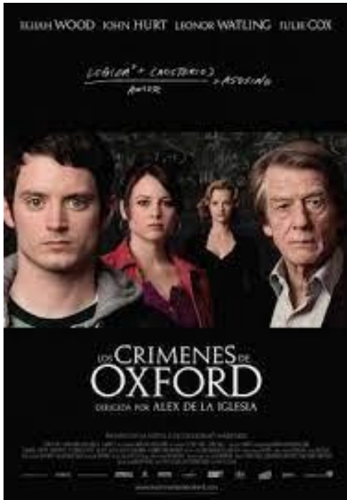
Los crímenes de Oxford