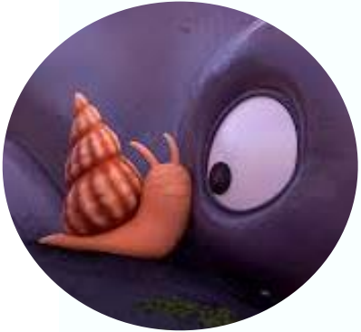
El Cargol i la balena