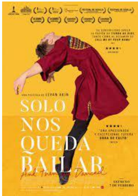
Solo nos queda bailar