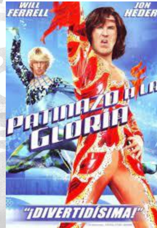
Patinazo a la gloria