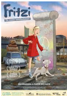
Fritzi, un conte revolucionari