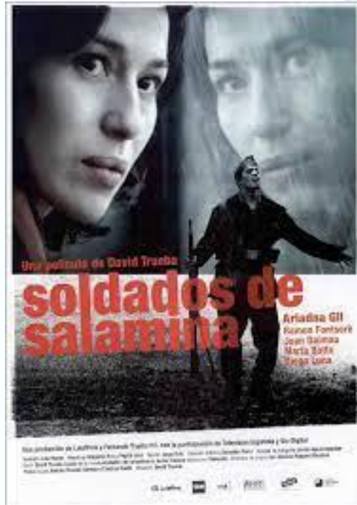
Soldados de Salamina