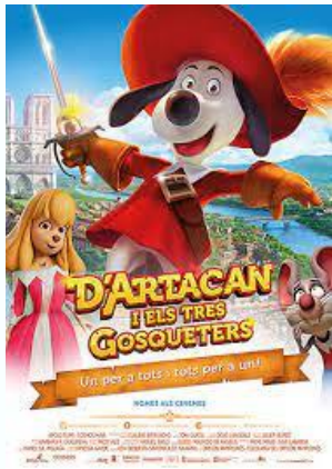
D'Artacan i els tres gostequers