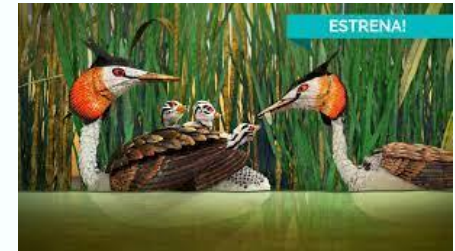
Bon dia, món!