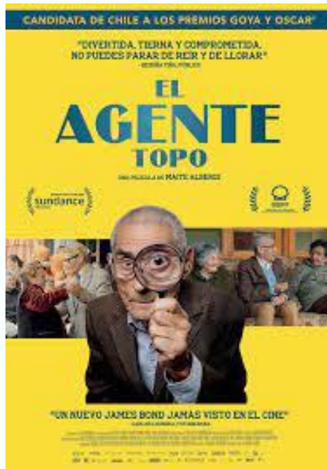
El Agente topo